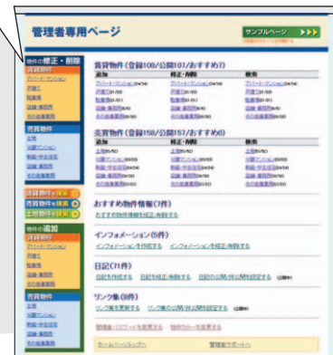
●管理者専用ページトップ画面